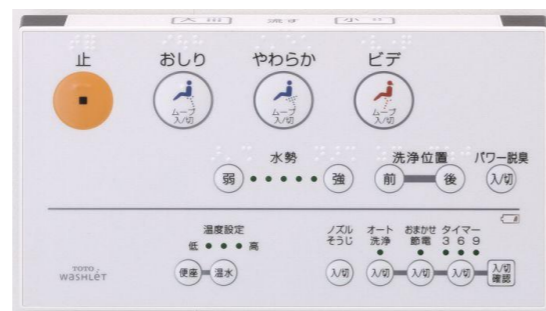
ウォシュレット用リモコン