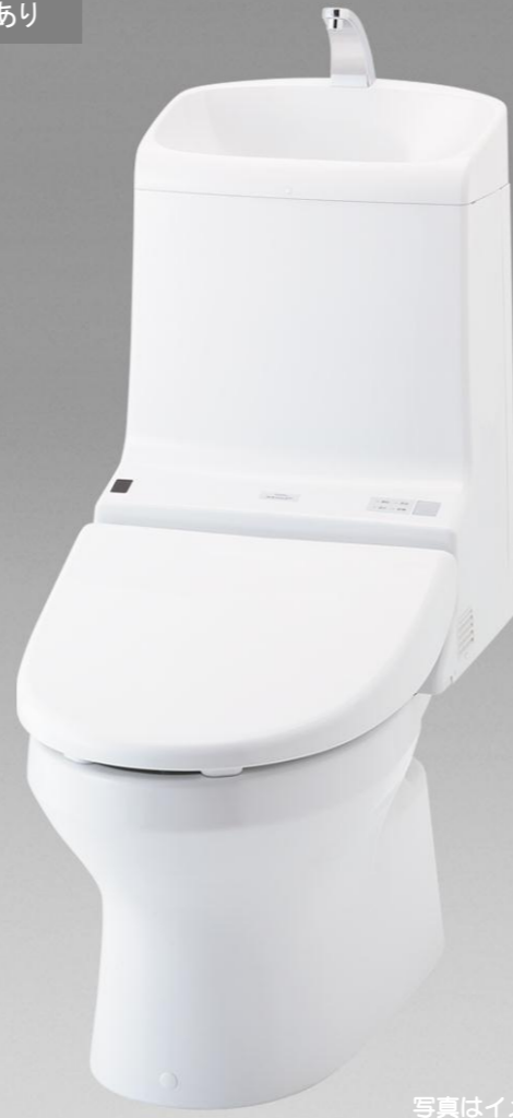
■ Z J (手洗あり) CES9134L #NW1