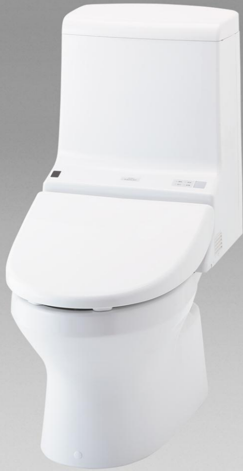
■ Z J (手洗なし) CES9134 #NW1